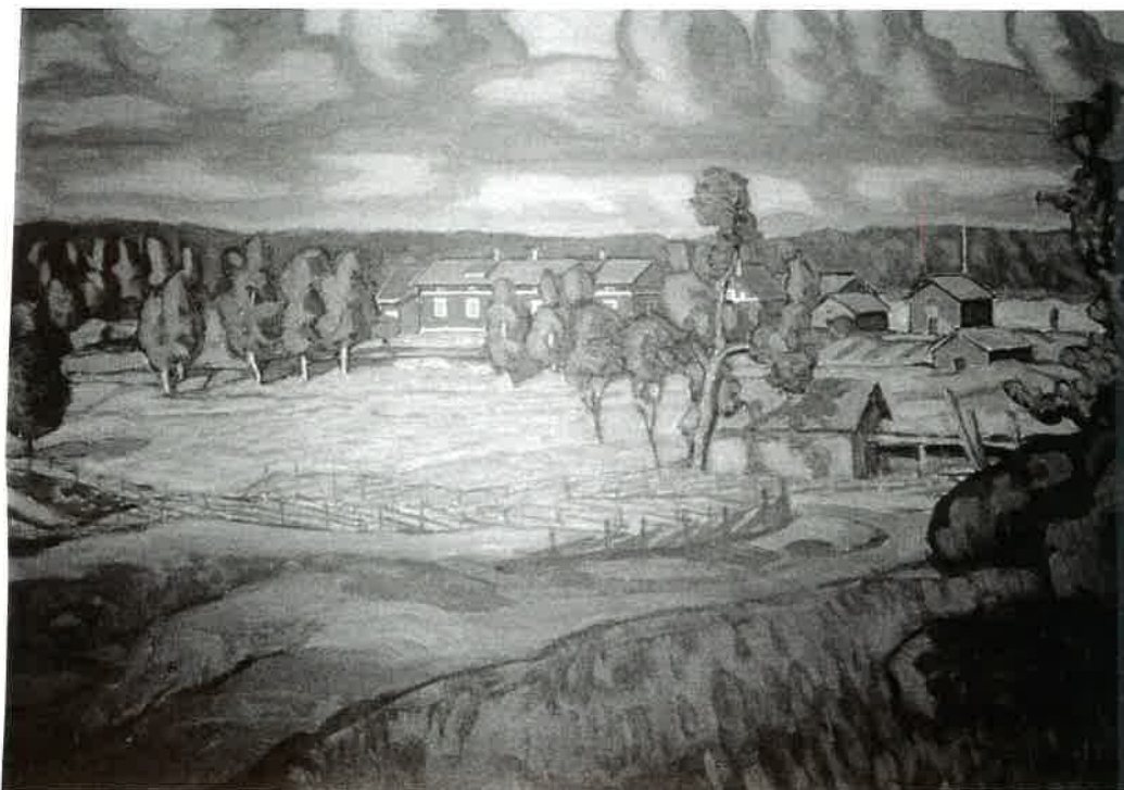
Viiron talo Laitilan Mudaisten kylässä. Maalaus 1920-luvulta.