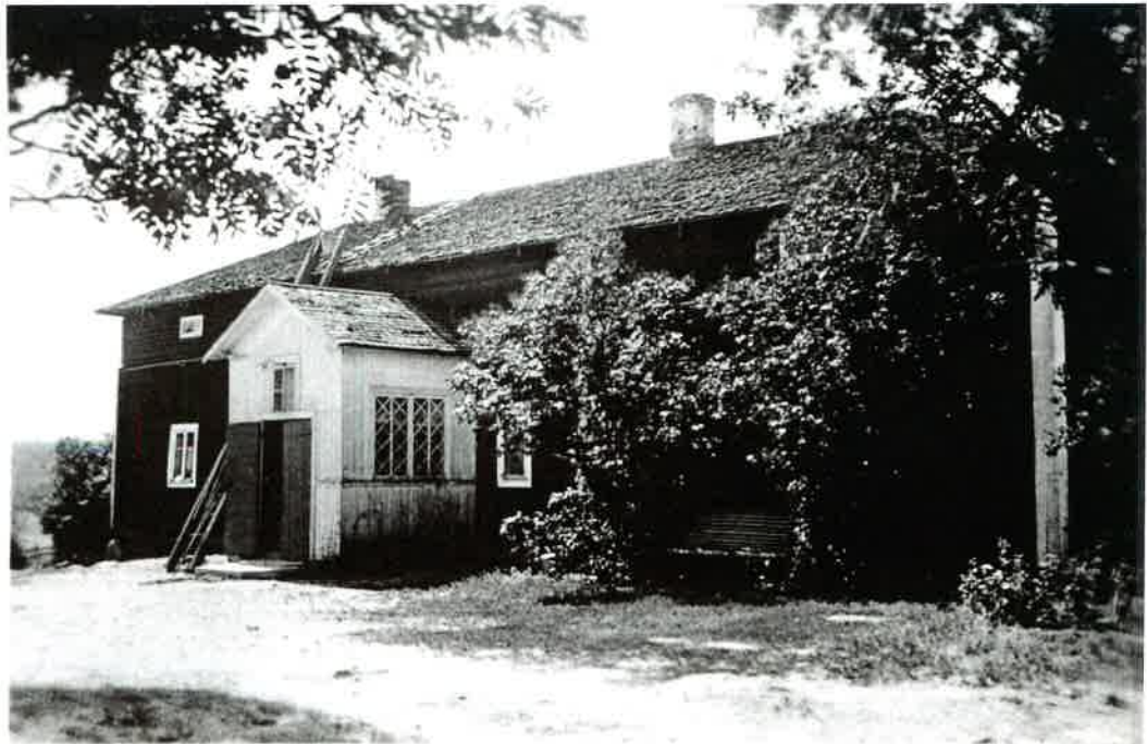
Vuolan talo kuvattuna joskus 1900-luvun alkupuolella.