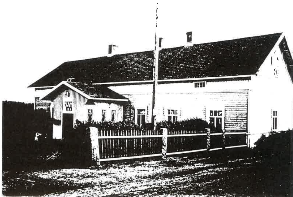
Huiskalan talo Laitilan Mudaisissa.